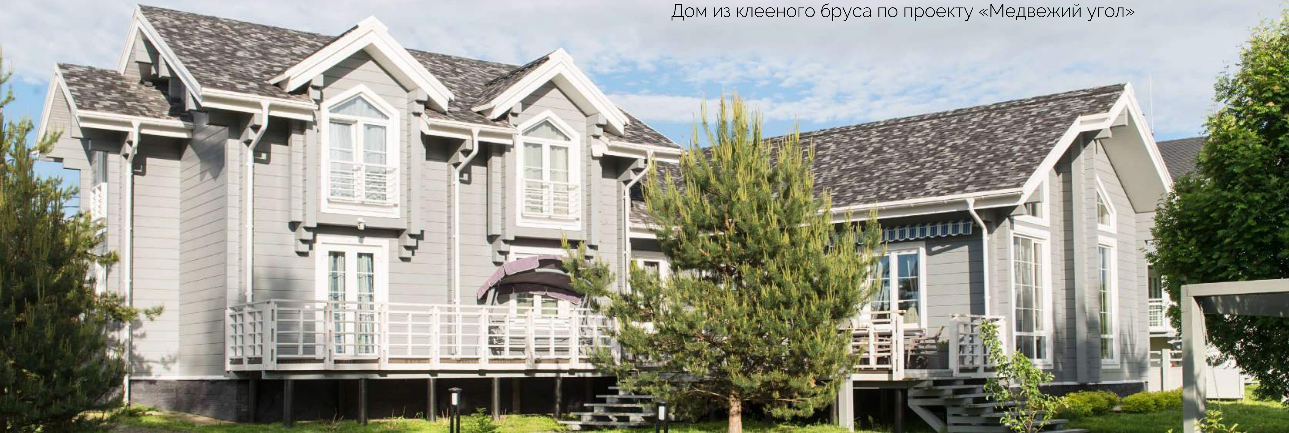
Дом из клееного бруса по проекту «Медвежий угол»